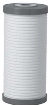
AP810 / AP811