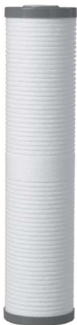
AP810-2 / AP811-2